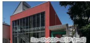
ミュージックスクール「ダ・カーポ」