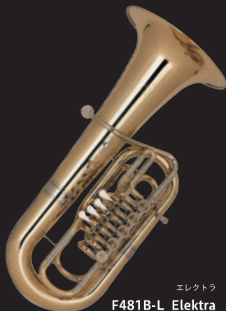
エレクトラ F481B-L Elektra